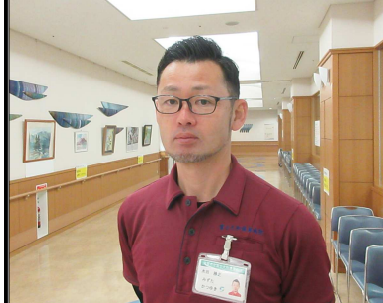
佐賀市立富士大和温泉病院 電話 0958-63-0111 ホームページ http://www.hospitalfj.saga.jp/